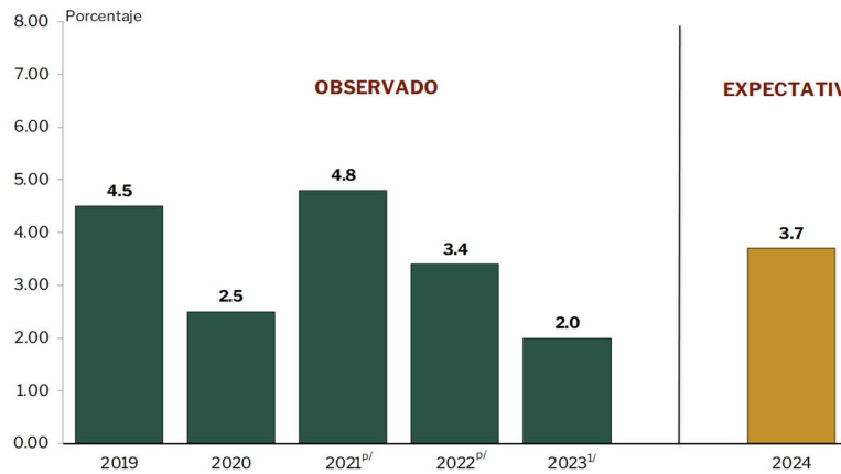
TASA DE CRECIMIENTO DEL PRODUCTO INTERNO BRUTO REAL DEL CUARTO TRIMESTRE OBSERVADO DE 2019 A 2023 Y EXPECTATIVAS PARA EL CUARTO TRIMESTRE DE 2024

El Panel estima que el Producto Interno Bruto Real Trimestral correspondiente al cuarto trimestre de 2024 registraría un crecimiento de 3.7%, superior en 0.1 puntos porcentuales a la previsión realizada en enero de 2025 (3.6% en la encuesta previa).