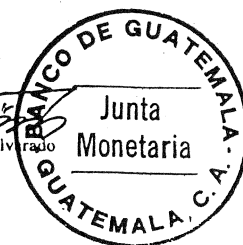
ANEXO PROGRAMA MONETARIO Y FISCAL 2005 En millones de Q.