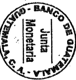
ANEXO PROGRAMA MONETARIO Y FISCAL 2007 Millones de quetzales