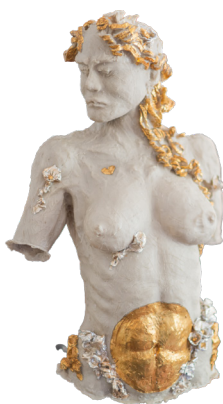
Título: MUSA III Técnica: Resina poliéster natural laminado Medidas: 45 x 40 x 80 cm Año: 2024