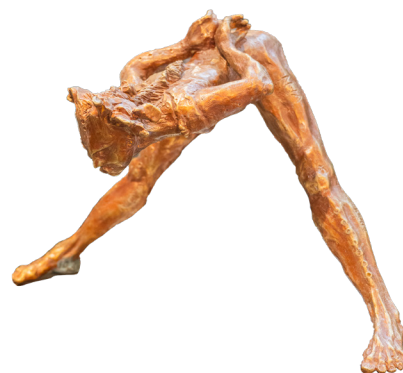
Título: TE ESPERO Técnica: Bronce a la cera perdida Medidas: 55 x 35 x 35 cm Año: 2024