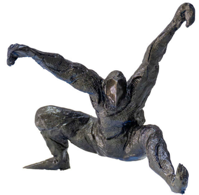
Título: EL MOMENTO Técnica: Resina y madera Medidas: 27 x 19 x 30 cm Año: 2025