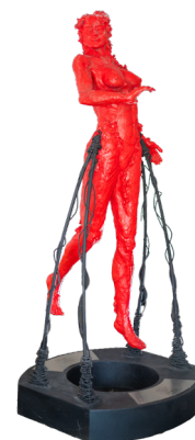
Título: VENUS Técnica: Resina poliéster y color Medidas: 75 x 55 x 175 cm Base de metal 90 x 90 x 150 cm Año: 2024