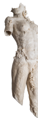
Título: MNENE Técnica: Resina poliéster natural Medidas: 45 x 40 x 130 cm Año: 2024