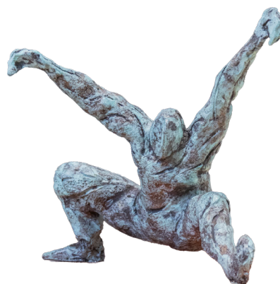
Título: EL MOMENTO Técnica: Bronce Medidas: 27 x 19 x 30 cm Año: 2025