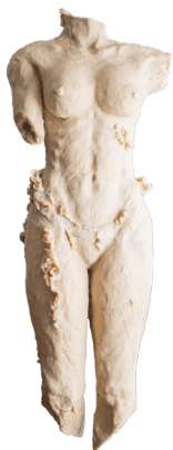
Título: TORSO DE MUJER Técnica: Resina poliéster natural Medidas: 45 x 40 x 145 cm Año: 2024