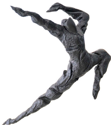
Título: EL SALTO Técnica: Resina / madera Medidas: 40 x 20 x 30 cm Año: 2023