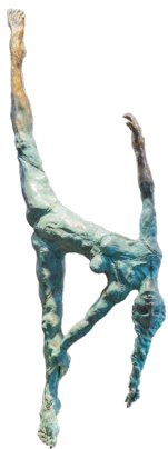
Título: EQUILIBRIO Técnica: Bronce a la cera perdida Medidas: 38 x 25 x 110 cm Año: 2024