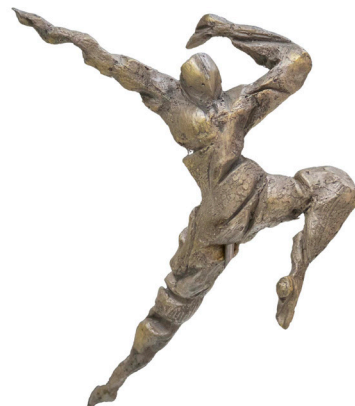
Título: EL SALTO Técnica: Bronce B / madera Medidas: 40 x 20 x 30 cm Año: 2023