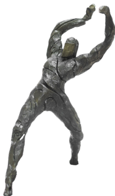
Título: EL GRANDE Técnica: Resina y madera Medidas: 52 x 15.5 x 45 cm Año: 2025