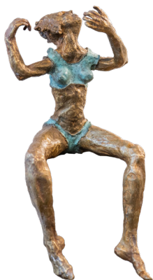
Título: EL DIÁLOGO Técnica: Bronce a la cera perdida Medidas: 25 x 25 x 55 cm Año: 2024