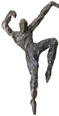
Título: EL GESTO Técnica: Resina y madera Medidas: 43 x 19 x 19 cm Año: 2025