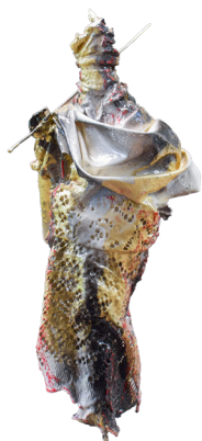
Título: LA MAGA Técnica: Polímeros poliuretanos / tela / propilenos / papel celulosa / metal Medidas: 75 x 30 x 30 cm Año: 2025