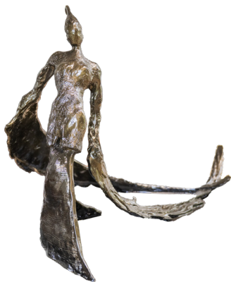
Título: LA POÉTICA Técnica: Resina Medidas: 56 x 48 x 93 cm Año: 2025