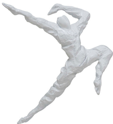
Título: EL SALTO Técnica: Resina / madera Medidas: 40 x 20 x 30 cm Año: 2023