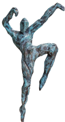
Título: EL GESTO Técnica: Bronce Medidas: 43 x 19 x 19 cm Año: 2025