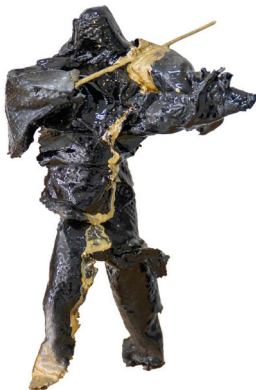
Título: VIRTUOSO Técnica: Polímeros poliuretanos / tela propilenos / papelcelulosa / metal B madera Medidas: 34 x 45 x 12 cm Año: 2025