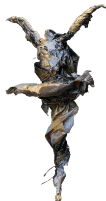
Título: LIBERTAD Técnica: Polímeros poliuretanos / tela / propilenos / papel celulosa / metal Medidas: 150 x 40x 40 cm Año: 2025