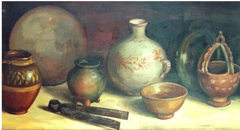
Bodegón Chapín Autor: Manolo Gallardo Técnica: Óleo