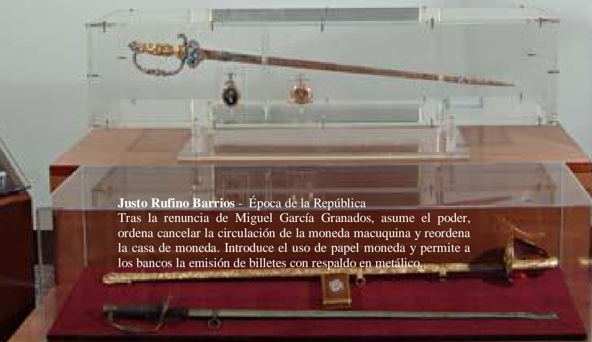
Época de la República

Justo Rufino Barrios - Época de la República Tras la renuncia de Miguel García Granados, asume el poder, ordena cancelar la circulación de la moneda macuquina y reordena la casa de moneda. Introduce el uso de papel moneda y permite a los bancos la emisión de billetes con respaldo en metálico.